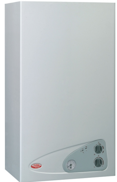
Komandna tabla za Panareu